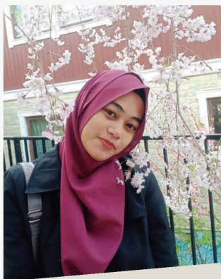
小規模多機能 ここさいむら美の里 デウィフォルトウナさん 入社年月: 2026年3月